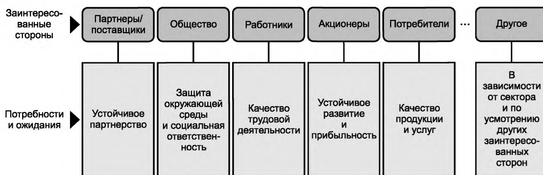
Рисунок 2 — Примеры заинтересованных сторон и их потребностей и ожиданий

Перечень заинтересованных сторон может значительно меняться с течением времени и отличаться в зависимости от организации, отрасли, культуры и страны. На рисунке 2 приведены примеры заинтересованных сторон и их потребностей и ожиданий.