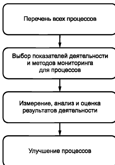
Рисунок 4 — Шаги для использования показателей деятельности

Выбор соответствующих показателей деятельности и методов мониторинга имеет большое значение для результативного измерения и анализа организации. На рисунке 4 представлены шаги для использования показателей деятельности.